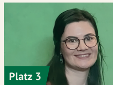
Lena Weithofer 35 Jahre, Regierungsrätin im Staatsministerium, Esslingen

„Machen wir aus der Region eine Nachhaltigkeitsregion: mit zukunftsfähigen und nachhaltigen Industrien, leistungsfähigem und verlässlichem ÖPNV und einer starken und weltoffenen Zivilgesellschaft.“